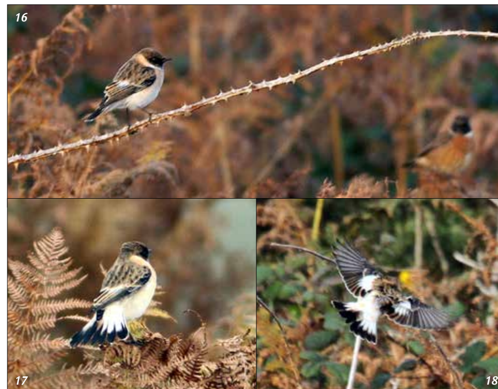
16 à 18. Tarier de la Caspienne Saxicola maurus variegatus , mâle, Ouessant, Finistère, octobre 2015. Male Eastern Stonechat of Caspian race variegatus , the second for France.

(De la Finlande à la Sibérie orientale et au Japon). Une nouvelle mention pour cette espèce, avec un oiseau qui a malheureusement fini ses jours contre la vitre d'une véranda... La localité plutôt intérieure est intéressante, mais la date est classique.