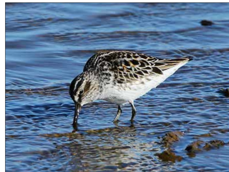
4. Bécasseau falcinelle Calidris falcinellus , Hyères, Var, mai 2015 (Aurélien Audevard). Broad-billed Sandpiper .

(Amérique du Nord). Donnée dans la norme par la date et le lieu, pour un limicole devenu un visiteur tout juste annuel en France.