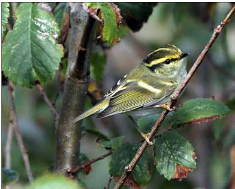
12. Pouillot de Pallas Phylloscopus proregulus , Ouessant, Finistère, octobre 2015. Pallas's Leaf-warbler .

(Asie centrale, de l'Est et du Sud-Est). Une petite année avec seulement deux mentions, en provenance de deux départements déjà visités de nombreuses fois par l'espèce, et à des dates relativement classiques. La donnée de 2014 dans le Doubs est nettement plus originale par sa localisation, même s'il s'agit d'une seconde départementale, après celle d'un oiseau le 20 septembre 1995 à Osselle (V. Ornithos 7-4: 166).