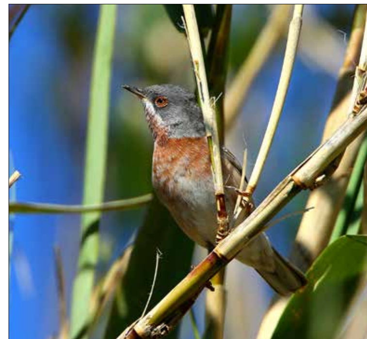
15. Fauvette des Balkans Sylvia cantillans albistriata , mâle, Hyères, Var, mars 2015. Male Eastern Subalpine Warbler.