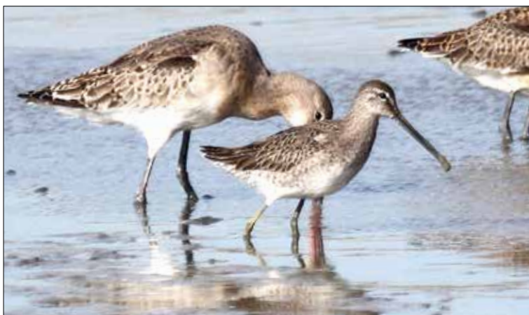
5. Bécassin à long bec Limnodromus scolopaceus , Bourgneuf-en-Retz, Loire-Atlantique, octobre 2015 (Hugo Touzé). First- winter Long-billed Dowitcher.

(Amérique du Nord). Donnée intéressante pour cette année 2015, très pauvre en limicoles néarctiques à l'exception notable du Chevalier à pattes jaunes, à une date et en un lieu attendus pour cette espèce.