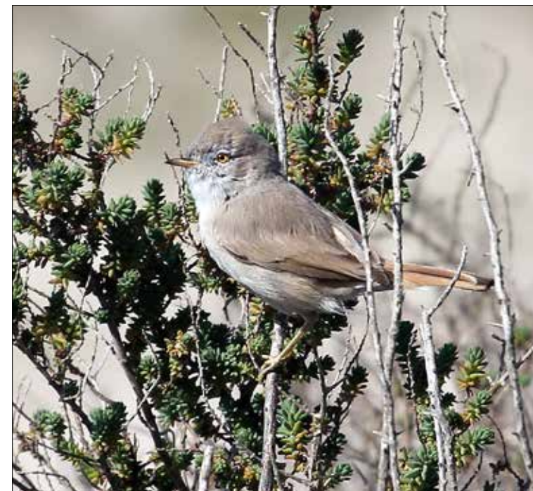
14. Fauvette naine Sylvia nana , île de Noirmoutier, L'Épine, Vendée, mars 2015 (Frédéric Veyrunes). Asian Desert Warbler.

(De la Slovénie à l'ouest de la Turquie). Le CHN a récemment terminé la révision des données françaises des Fauvettes passerinettes orientales, à la lumière de publications récentes sur la systématique, la nomenclature et l'identification du complexe Sylvia cantillans (SVENSSON 2013a, 2013b). La systématique appliquée