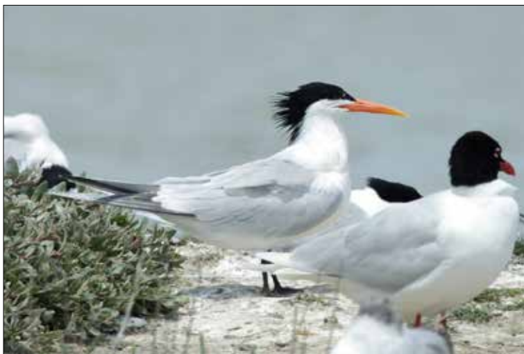
7. Sterne élégante Sterna elegans , Arles, Bouches-du-Rhône, août 2015 (François Duchenne). Elegant Tern .