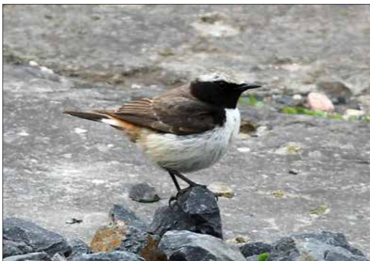
1. Traquet kurde Oenanthe xanthopyrna , mâle 2 e année, Orcines, Puy-de-Dôme, mai 2015 (Frédéric Veyrunes). 2nd-cy male Kurdish Wheatear.

L'année 2015 a été plutôt contrastée, plutôt médiocre sur le plan des limicoles néarctiques et des passereaux sibériens à l'automne, elle fournit néanmoins trois nouvelles espèces à la Liste des oiseaux de France : l'Albatros à nez jaune Thalassarche chlororhynchos , la Fauvette naine Sylvia nana et le Traquet kurde Oenanthe xanthopyrna , pour lequel il s'agit également de la première mention ouest-européenne ! On relèvera aussi les secondes données françaises pour le Rougequeue noir oriental Phoenicurus ochruros phoenicuroides et le Traquet à tête blanche Oenanthe leucopyga . Le Martinet des maisons Apus affinis , le Pic à dos blanc de la sous-espèce nominale Dendrocopos leucotos leucotos et la Pie-grièche brune Lanius cristatus fournissent leur troisième mention française, tandis que le Gravelot asiatique Anarhynchus asiaticus en est désormais à quatre. Plusieurs espèces ont montré en 2015 un record d'affluence, à savoir le Bécasseau falcinelle Limicola falcinellus (24 oiseaux), le Chevalier à pattes jaunes Tringa flavipes (7), la Bécassine double Gallinago media (26) et le Bruant nain Emberiza pusilla (12). Enfin, cette année constitue un cru très honorable pour la Sarcelle à ailes bleues Anas discors (4 individus), la Mouette de Franklin Larus pipixcan (4) et le Traquet du désert Oenanthe deserti (6).