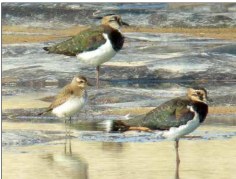
3. Gravelot asiatique Anarhynchus asiaticus , Ruan, Loiret, septembre 2015 (Pierre Laur-Fournié). Caspian Plover .

Loiret – Ruan, juv., phot., du 11 au 15 septembre (S. Branchereau, P. Chevrier, M. Lacroix).