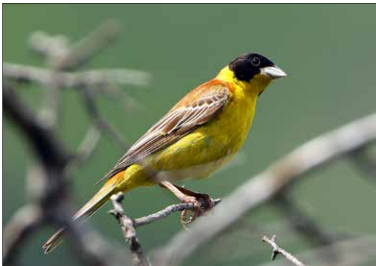
21. Bruant mélanocéphale Emberiza melanocephala , mâle, Saint-Pancrace, Hautes-Alpes, juin 2015. Male Black-headed Bunting.