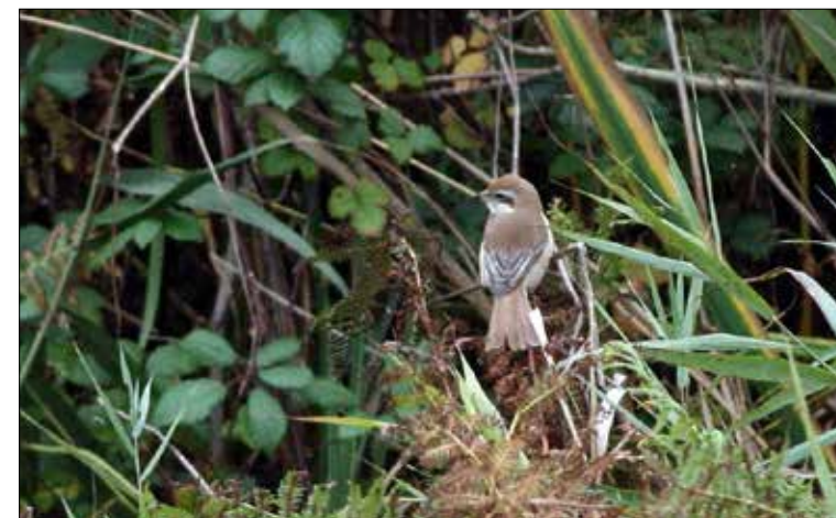
11. Pie-grièche brune Lanius cristatus , 1 re année, Ouessant, Finistère, octobre 2015. First-year Brown Shrike .

(Sibérie à l'est de l'Ienisseï jusqu'à l'Anadyr, au Kamchatka, au Japon et en Chine). Belle découverte que cette troisième mention française, la première pour le Finistère et Ouessant, après celles d'octobre 2000 à Hoëdic (V. Ornithos 10-2 : 75) et de novembre 2004 à Noirmoutier (V. Ornithos 13-2 : 103).