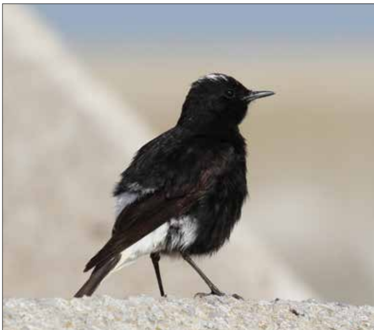
19. Traquet à tête blanche Oenanthe leucopyga , mâle 2 e année, Palavas-les-Flots, Hérault, mai 2015. 2 nd -cy male White-crowned Black Wheatear.

(Afrique du Nord). Seconde mention française et première pour la période contemporaine, après celle d'un mâle tué le 21 avril 1884 dans le sud du pays (DUBOIS et al. 2008). Une note détaillant cette découverte sera publiée prochainement dans Ornithos .