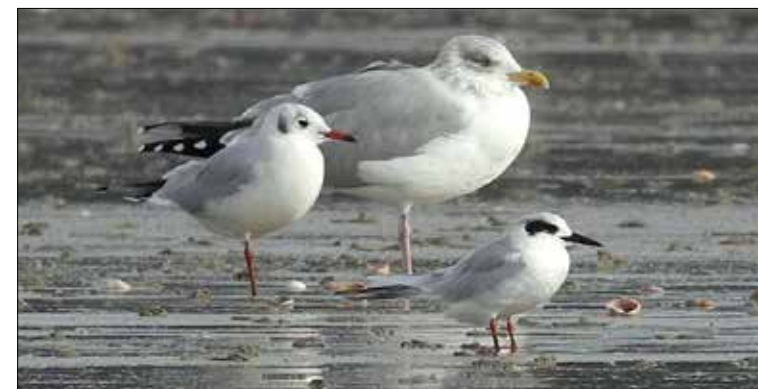
8. Sterne de Forster Sterna forsteri , Granville, Manche, novembre 2015. Forster's Tern .

(Côtes de la mer Baltique, nord de la Norvège et Finlande jusqu'en mer Blanche). Septième mention française pour cette sous-espèce, au sujet de laquelle le CHN a jugé plus sage de ne s'en tenir qu'aux mentions d'oiseaux bagués sur des colonies, où seule cette sous-espèce est signalée nicheuse. Selon ALTENBURG et al. (2011), les oiseaux de cette sous-espèce ne peuvent être distingués des intermédiaires avec la sous-espèce intermedius , plus méridionale et régulière en France, que dans leur 2 e année et seulement entre avril et juin.